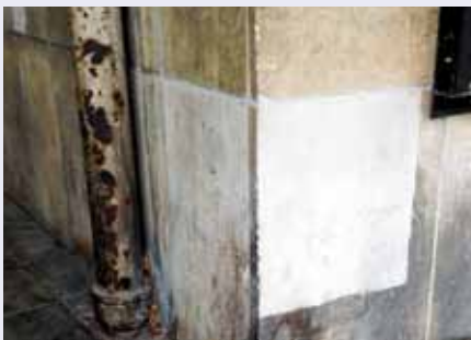
Verschmutzung auf Sandstein