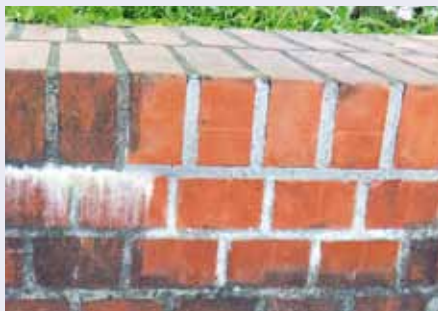
Salpeter auf Klinker