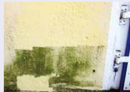
Vermoosung auf Farbanstrich