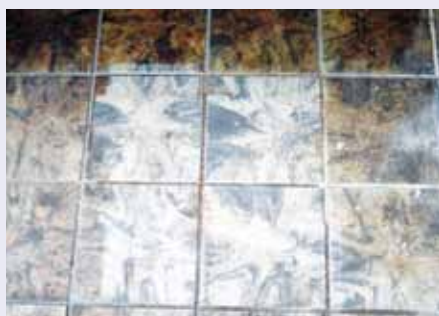
Rost auf Fliesen