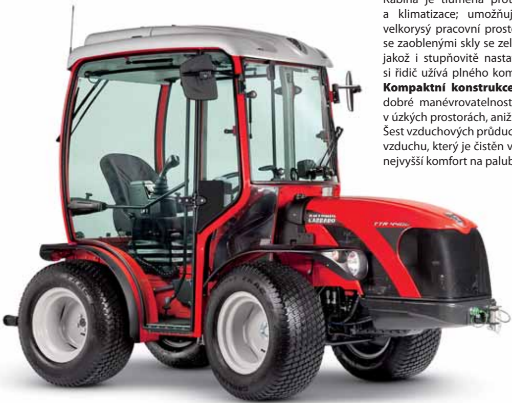
Kabina traktoru TTR 4400 HST je originální produkt značky AC, certifikovaný, schválený a vybavený záruční dobou 24 měsíců. Strukturálními vnějšími kvalitativními znaky odpovídá designu koncepce traktorů AC.