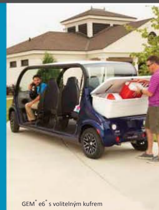
GEM® e6 s volitelným kufrem