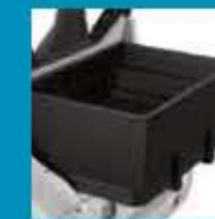
S PEVNÝMI STRANAMI