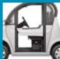
ČTVRTVÉ PEVNÉ DVEŘE

Odmontovatelné varianty pevných dveří zlepšují bezpečnost a ochranu proti vnějším vlivům.