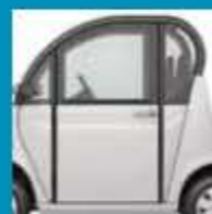
PLNÉ PEVNÉ DVEŘE