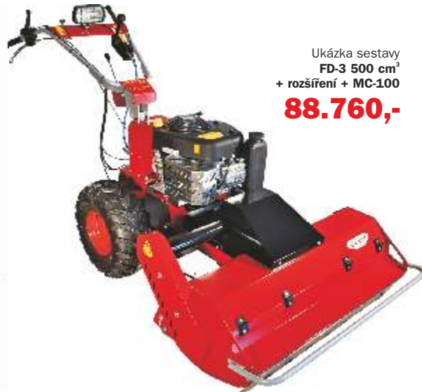
Ukázka sestavy FD-3 500 cm 3 + rozšíření + MC-100