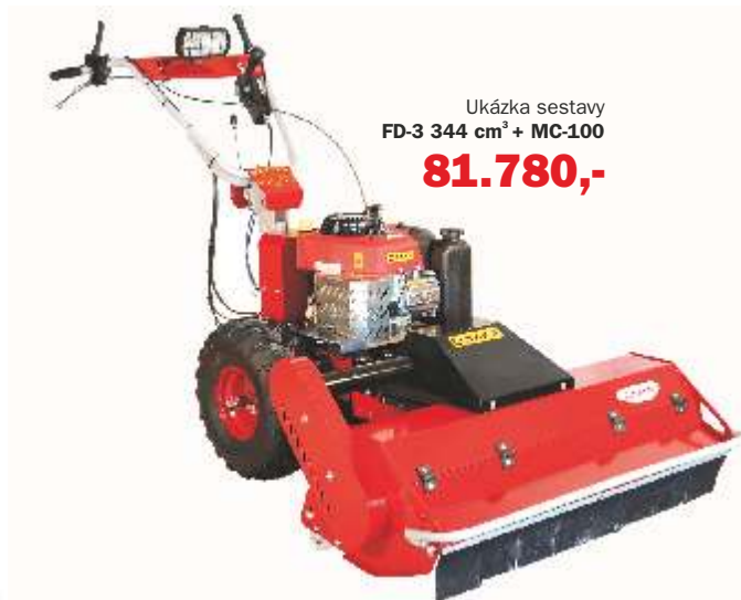
Ukázka sestavy FD-3 344 cm 3 + MC-100