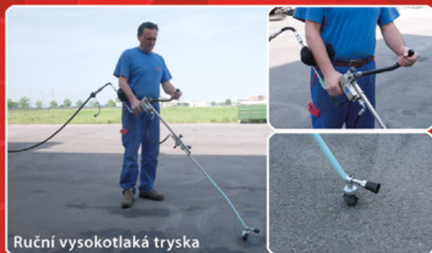
Ruční vysokotlaká tryska