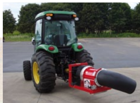
Model Buffalo Cyclone PTO nesený za traktor.