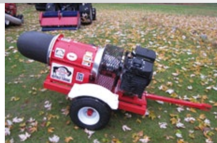
Jednoduchá konstrukce a snadný přístup pro údržbu. Model Buffalo KB4 a Cyclone 8000.