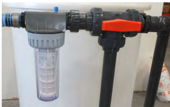
Robustní filtr a třicícný ventil