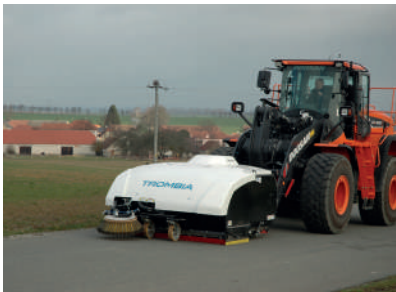
Silnice a cesty