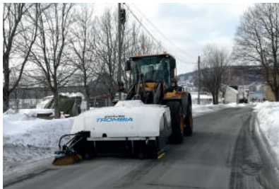
Zametání v teplotách pod bodem mrazu – Trombia nepoužívá pro zametání vodu, která by mohla zamrznout!