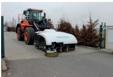
Zametání odpadu z ulic