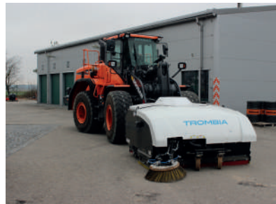
Vojenské základny, přístavy a letiště