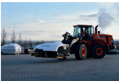
Jarní úklid písku a prachu po zimě