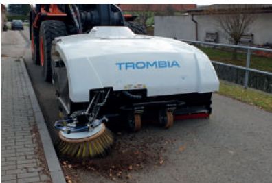
Sběr a zametání listů