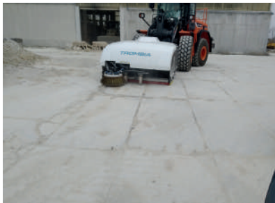
Průmyslové areály, lomy a tunely