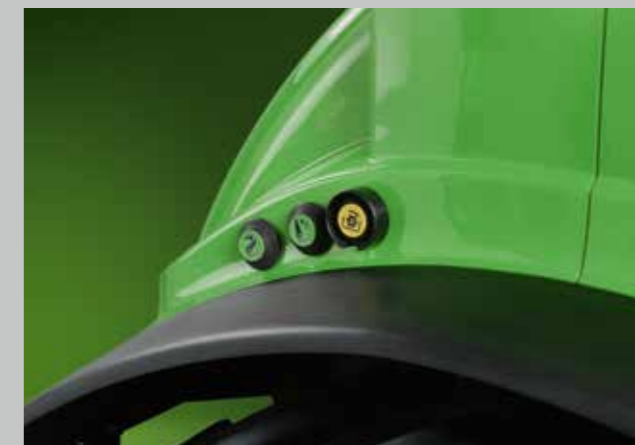
Zadní tříbodový závěs a vývodová hřídel jsou ovládány tlačítky na zadních blatnících.