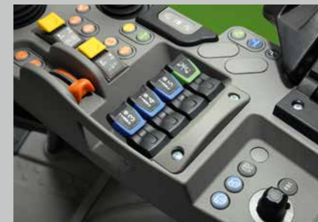
Precizní ovládání přídavných hydraulických okruhů a zadního tříbodového závěsu je ergonomicky umístěné přímo na loketní opěrce MaxCom.