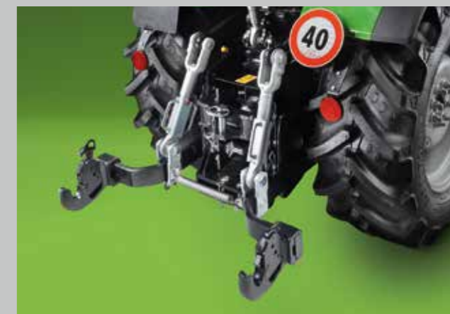
Elektronicky ovládaný zadní tříbodový závěs s maximální kapacitou zdvihu 2.600 kg.