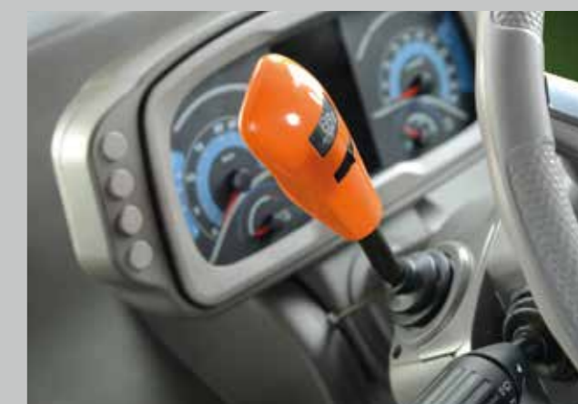
Směr jízdy může být změněn individuálně nastavitelnou PowerShuttle pákou nalevo od volantu.