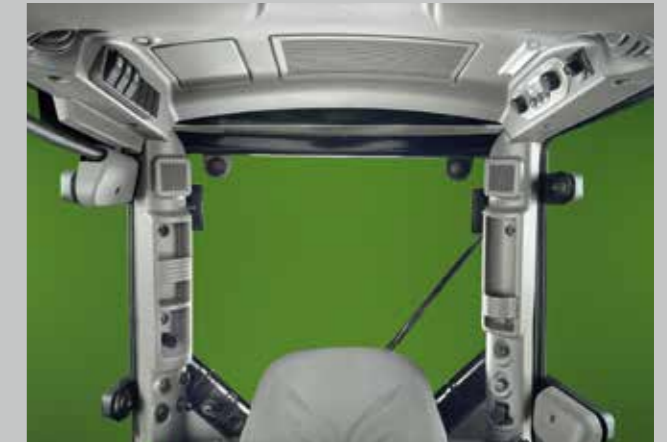
Ovládání klimatizace je snadno dostupné na panelu ve střeše kabiny.