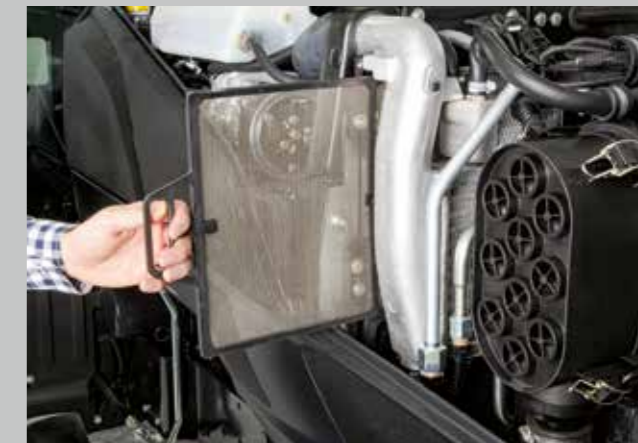
Velký přepracovaný chladicí systém, vylepšené vedení vzduchu a PowerCore vzduchový filtr podporují účinnost motoru.