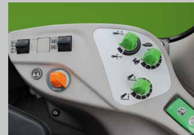
Jasně barevně rozlišená tlačítka a otočné ovladače pro snadné ovládání.