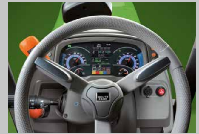
Přístrojová deska poskytuje řidiči analogové a digitální informace o pracovním stavu traktoru v reálném čase.

5" barevný displej InfoCenterPro s vysokým rozlišením poskytuje řidiči jasně strukturované informace o všech provozních stavech traktoru. Rychlost jízdy a otáčky motoru ukazují analogové budíky. Řidič dostává všechny informace v reálném čase a může programovat operační sekvence. Ovládací prvky určené pro aktivaci automatických funkcí, jako je odpružení přední nápravy, automatické spínání pohonu všech kol a SSD rychlé natáčení kol, stejně jako páka pro hydraulickou ruční brzdu (HPB) a držák mobilního telefonu jsou umístěny po levé a pravé straně od displeje InfoCenterPro. Sedadlo řidiče se vzduchovým odpružením a multimediální rádio jsou k dostání jako volitelná výbava. Ta přináší řidiči vše, co potřebuje pro pohodlné a efektivní splnění jeho úkolu.