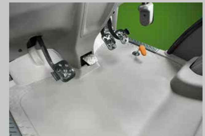
Rovná podlaha kabiny přináší celkově více místa, více prostoru pro nohy a optimální umístění nohou na pedálech při sezení.

Velká prosklená plocha čelního skla z jednoho kusu prodloužená až do střešky kabiny nabízí excelentní výhled na všechna připojitelná nářadí. Otevíratelné přední sklo je dostupné v rámci volitelné výbavy. Díky instalaci speciálního filtru a systému vyrovnávání tlaku integrovaného do nově vyvinuté kabiny splňuje kabina všechny standardy (třída IV) pro ochranu řidiče a osobní ochranné pomůcky se tak stávají nepotřebnými.