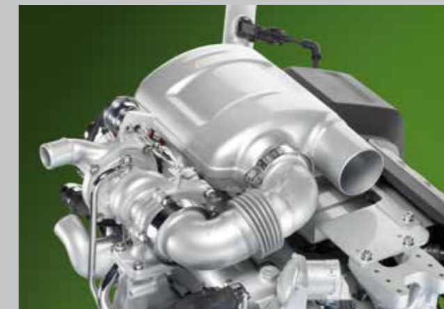
Jedinečný kompaktní systém DOC plní všechny emisní standardy bez přidávání AdBlue či filtru pevných částic.