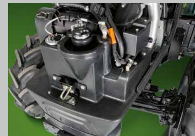
Palivová nádrž je integrována do bloku přední nápravy a lze ji plnit i při zavřené kapotě. Druhá přídavná nádrž se nachází pod podvozkem.