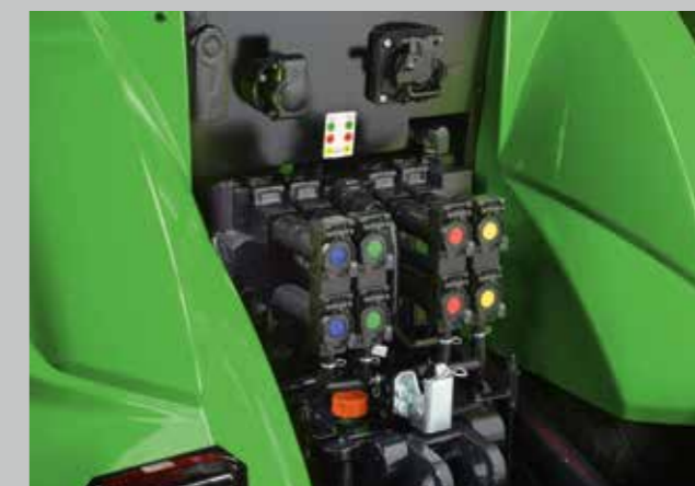
Pět dvojčinných, elektronicky ovládaných hydraulických okruhů pro ovládání a pohon nářadí.